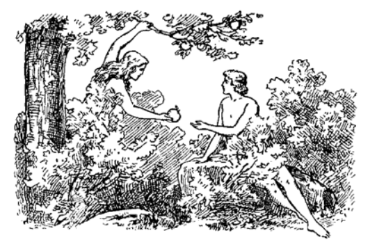
Kamwe tusisikilize sauti ya Shetani.